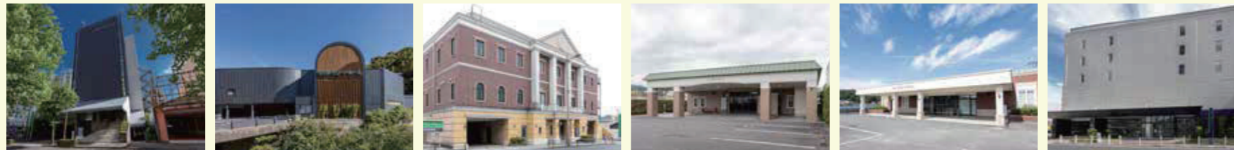
元町メモリードホール 春日メモリードホール 稲荷メモリードホール 日野メモリードホール メモリードホール早岐 メモリードホール早岐駅前