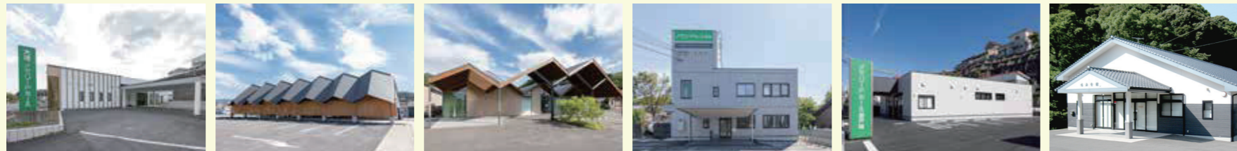
大塔メモリードホール 相浦メモリードホール 佐々メモリードホール メモリードホール福石 メモリードホール瀬戸越 メモリードホール大瀬戸

イベントお申込みにつきましては、右のハガキに必要事項をご記入のうえ、お近くのポストにご投函ください。