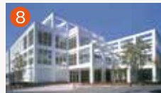
8 大橋メモリードホール 長崎市大橋町14-16