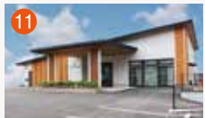
11 琴海メモリードホール 長崎市西海町1729-1