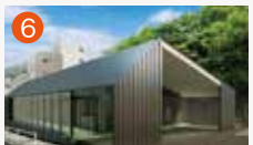
6 メモリードホール弥生 長崎市弥生町7-37