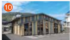
10 メモリードホール時津 西彼杵郡時津町浦郷443-5