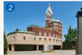
2 ロイヤルチェスター長崎 ホテル&リトリート 長崎市赤迫3-6-10