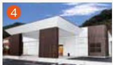
4 東長崎メモリードホール 長崎市東町1940