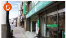
5 公善社大井手メモリードホール 長崎市大井手町44-2