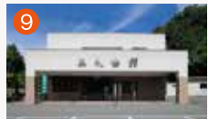
9 メモリード北部典礼会館 西彼杵郡長与町高田郷1789-5