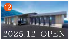
12 メモリードホール畝刈 長崎市畝刈町1613-38