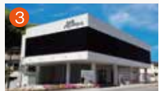
3 小ヶ倉メモリードホール 長崎市小ヶ倉町2丁目13-1