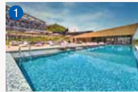
1 ガーデンテラス長崎 ホテル&リゾート 長崎市秋月町2-3