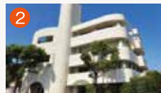
2 稲佐橋メモリードホール 長崎市稲佐町2-2