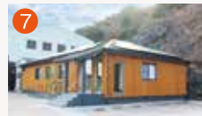
7 メモリードホール三和 長崎市布巻町154-1