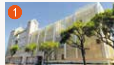
1 メモリード典礼会館 長崎市光町7-1