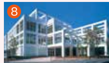
8 大橋メモリードホール 長崎市大橋町14-16