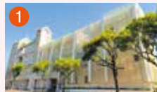
1 メモリード典礼会館 長崎市光明7-1