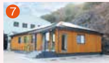
7 メモリードホール三和 長崎市布巻町154-1