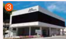
3 小ヶ倉メモリードホール 長崎市小ヶ倉町2丁目13-1