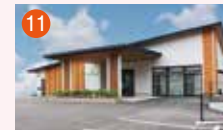
11 琴海メモリードホール 長崎市西海町1729-1