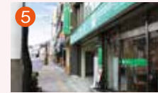
5 公善社大井手メモリードホール 長崎市大井手町44-2