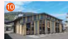
10 メモリードホール時津 西彼杵郡時津町浦郷443-5