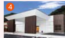
4 東長崎メモリードホール 長崎市東町1940