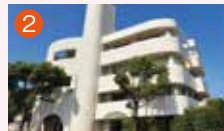
2 稲佐橋メモリードホール 長崎市稲佐町2-2