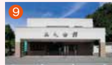
9 メモリード北部典礼会館 西彼杵郡長与町高田郷1789-5