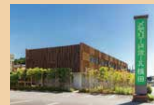
メモリードホール横田別館 飯塚市横田875-3 ホール数:2(着席5～25名)