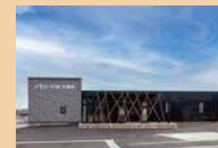
メモリードホール穂波 飯塚市楽市679-1 ホール数:1(着席10～60名)