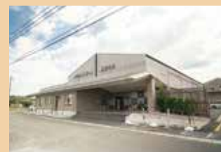
メモリードホール飯塚中央 飯塚市柳橋265-3 ホール数:1(着席15～100名)