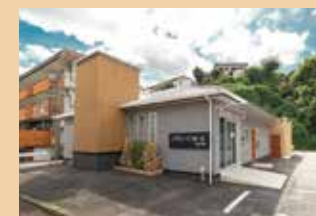
メモリードホール柏の森 飯塚市有井354-23 ホール数:1(着席5～20名)