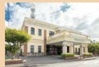
メモリードホール横田 飯塚市横田873-1 ホール数:2(着席15～180名)