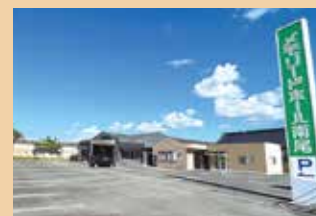
メモリードホール南尾 飯塚市南尾320 ホール数:1(着席10～70名)