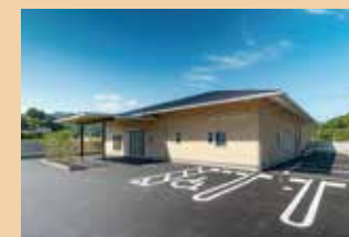
メモリードホール桂川 嘉穂郡桂川町土師4035 ホール数:1(着席10～60名)