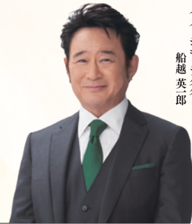
メモリード イメージキャラクター 船越英郎