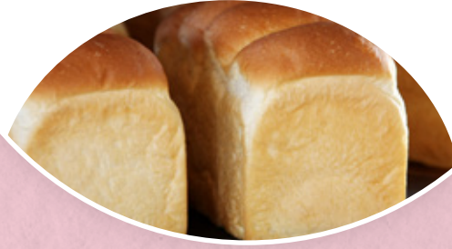
※画像はすべてイメージです