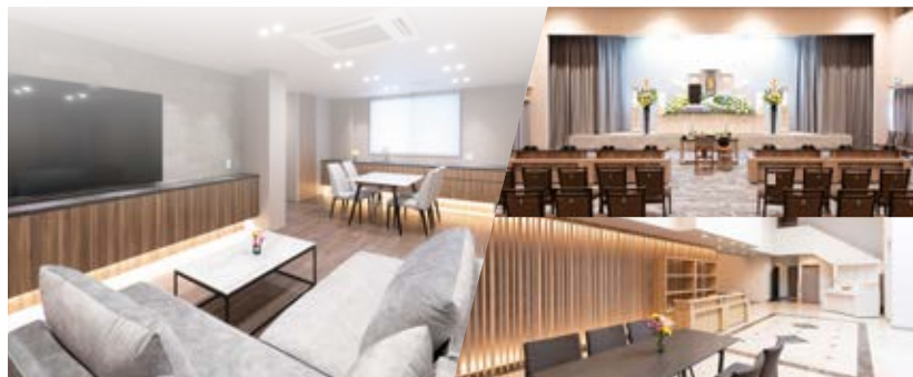
メモリードホール佐賀 東館 佐賀市光1丁目1-16

家族葬専用ホール MEMOLEAD ひかり 大切な方と ともに過ごす 家族葬 MEMOLEAD FUNERAL SERVICE