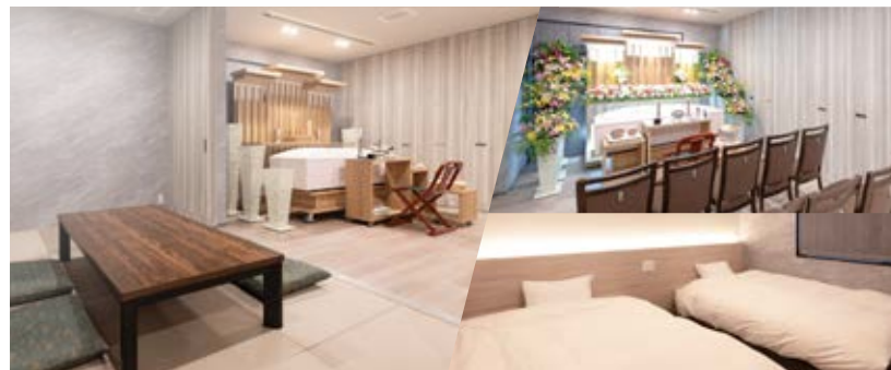
別邸ひかり 佐賀市光1丁目1-16

家族葬専用ホール MEMOLEAD ひかり 大切な方と ともに過ごす 家族葬 MEMOLEAD FUNERAL SERVICE