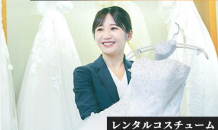
レンタルコスチューム