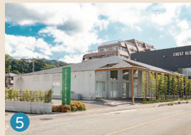
5 メモリードホール福岡空港 福岡市博多区金の隈1丁目28-73