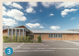
3 メモリードホール春日 春日市昇町6丁目72-2