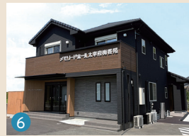
6 メモリードホール太宰府梅香苑 太宰府市梅香苑1丁目16-12