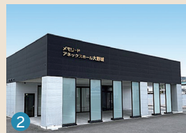
2 メモリードアネックスホール大野城 大野城市御笠川2丁目2-7