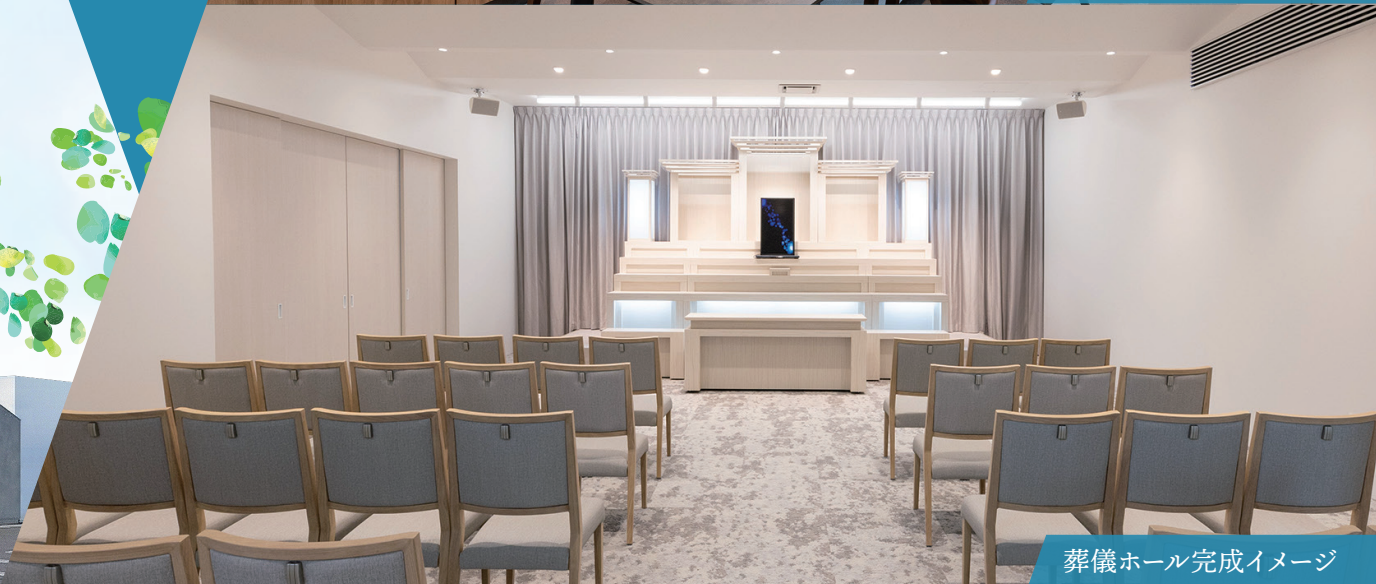
葬儀ホール完成イメージ