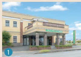
1 メモリードホール大野城 大野城市御笠川2丁目2-15