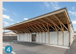
4 メモリードホール桜並木通り 福岡市博多区西春町3丁目1-5