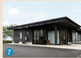
7 メモリードホール筑紫野美しが丘 筑紫野市美しが丘南7丁目6-1