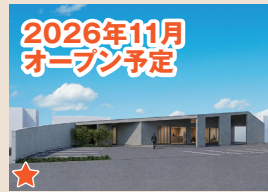
2026年11月オープン予定 メモリードホール宇美 糟屋郡宇美町宇美6丁目20-13