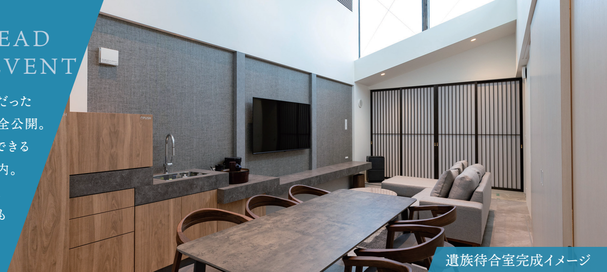
遺族待合室完成イメージ

今まで不透明だった ご葬儀費用の完全公開。 お安くご利用できる 方法をご案内。 勉強会后 個別相談も 承ります。