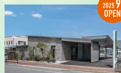
メモリードホール野方 西区野方1丁目22-1