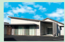
メモリードホール薬院 中央区警固3丁目1-15