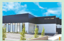
メモリードホール南福岡 南区の場2丁目26-11