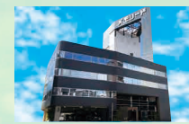
メモリードホール福岡 中央区警固3丁目1-7