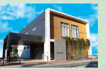
メモリードホール福大通り 城南区神松寺3丁目12-21