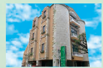
メモリードホール博多馬出 東区馬出1丁目11-15