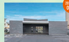
メモリードホール小戸 西区小戸3丁目51-6