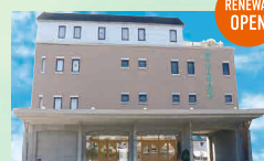
メモリードホール和白 東区和白2丁目1-40