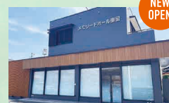
メモリードホール重留 早良区重留4丁目4-19