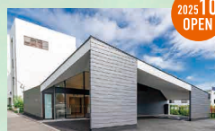
メモリードホール東光寺 博多区東光寺町2丁目8-28