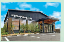
メモリードホール大池 南区寺塚1丁目9-20