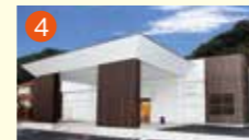
4 東長崎メモリードホール 長崎市東町1940