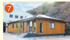
7 メモリードホール三和 長崎市布巻町154-1