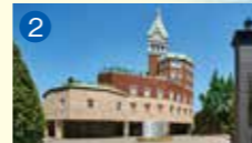
2 ロイヤルチェスター長崎 ホテル&リゾート 長崎市赤迫3-6-10