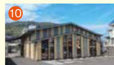
10 メモリードホール時津 西彼杵郡時津町浦郷443-5