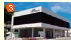
3 小ヶ倉メモリードホール 長崎市小ヶ倉町2丁目13-1