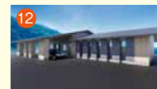
12 メモリードホール敵刈 長崎市敵刈町1613-38