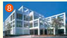
8 大橋メモリードホール 長崎市大橋町14-16