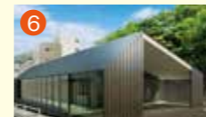
6 メモリードホール弥生 長崎市弥生町7-37