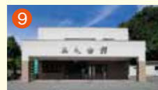
9 メモリード北部典礼会館 西彼杵郡長与町高田郷1789-5