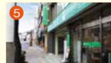
5 公善社大井手メモリードホール 長崎市大井手町44-2