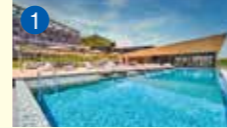
1 ガーデンテラス長崎 ホテル&リゾート 長崎市秋月町2-3