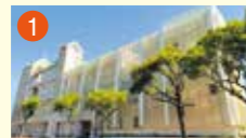
1 メモリード典礼会館 長崎市光町7-1