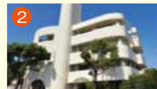
2 稲佐橋メモリードホール 長崎市稲佐町2-2