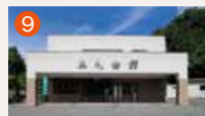
9 メモリード北部典礼会館 西彼杵郡長与町高田郷1789-5