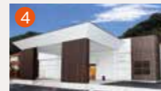
4 東長崎メモリードホール 長崎市東町1940