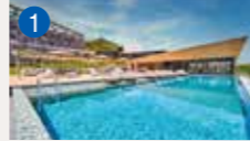
1 ガーデンテラス長崎 ホテル&リゾート 長崎市秋月町2-3