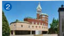
2 ロイヤルチェスター長崎 ホテル&リゾート 長崎市赤迫3-6-10