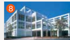
8 大橋メモリードホール 長崎市大橋町14-16