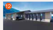
12 メモリードホール敵刈 長崎市敵刈町1613-38