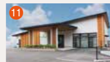
11 琴海メモリードホール 長崎市西海町1729-1