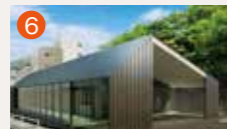
6 メモリードホール弥生 長崎市弥生町7-37