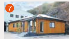
7 メモリードホール三和 長崎市布巻町154-1