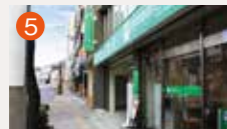
5 大井手メモリードホール 長崎市大井手町44-2